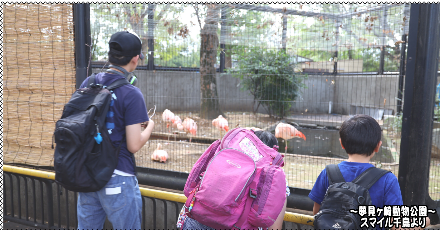
～夢見ヶ崎動物公園～ スマイル千鳥より

発行：株式会社スマイルキッズ 通信編集委員会 住所：東京都大田区南久が原2-12-14 三立ビル1F 電話：03-6715-2370 ■ 発達支援教室スマイル千鳥 ■ 発達支援教室スマイル久が原 ■ 発達支援教室スマイル久が原プラス ■ 移動支援事業所スマイルアクティブ